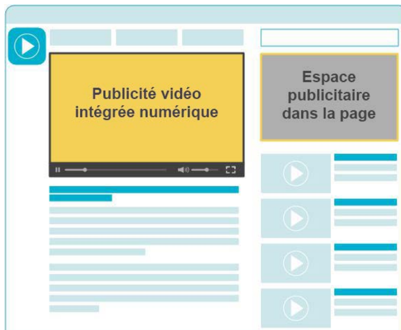
Figure 1a) : Exemple d'une publicité vidéo intégrée.

Les publicités vidéo intégrées sont diffusées habituellement au début ( pre-roll ), au milieu ( mid-roll ) ou à la fin ( post-roll ) du contenu de la séquence vidéo et peuvent être accompagnées d'une publicité compagnon dans la page. Pour des indications sur l'affichage du marqueur d'annonce dans l'espace publicitaire dans la page, vous reporter aux Lignes directrices concernant le marqueur d'annonce de la DAAC .