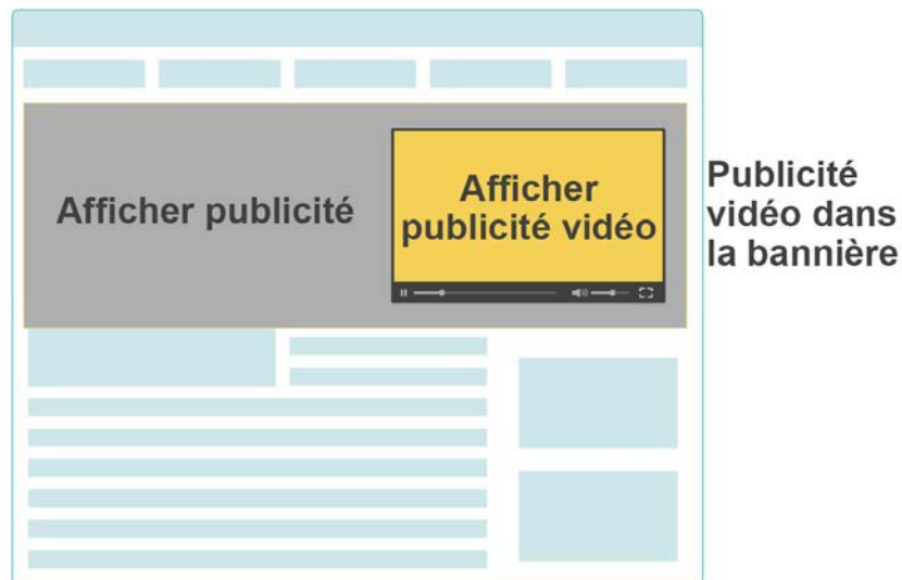
Figure 1 c)