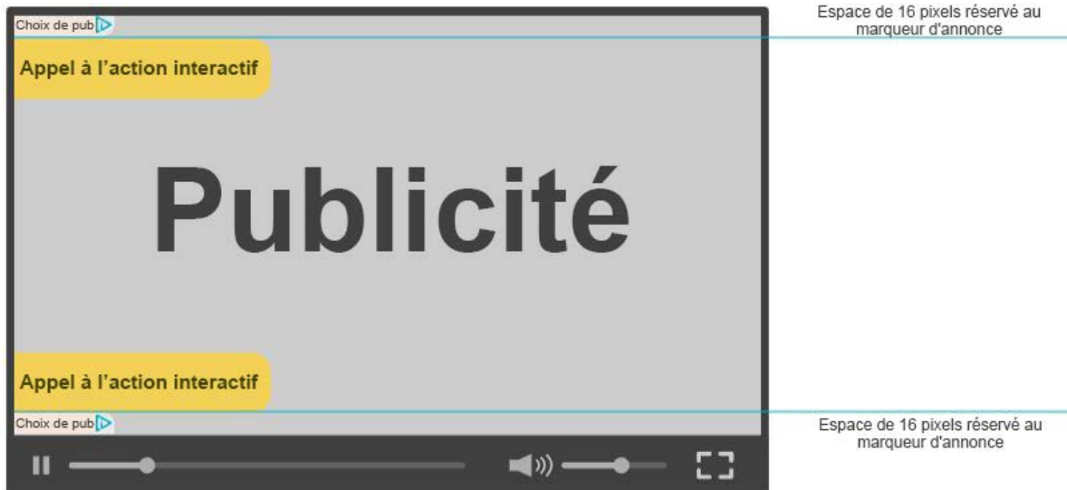
Figure 4 : Exemple de positionnement de l'icône combinée à un espace de 16 pixels au-dessus ou sous l'élément interactif.