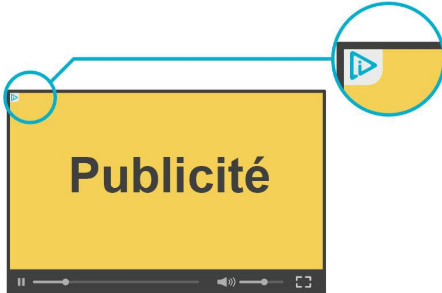
Figure 3 b) : Exemple de positionnement de l'icône dans le coin supérieur gauche de la vidéo, qui montre le marqueur d'annonce au complet (affichage large).

Pour permettre l'intégration d'autres éléments interactifs dans la publicité vidéo, une approche possible consiste à prévoir un espace de 16 pixels au haut ou au bas de la publicité vidéo afin de permettre le positionnement de l'icône ou du marqueur d'annonce.